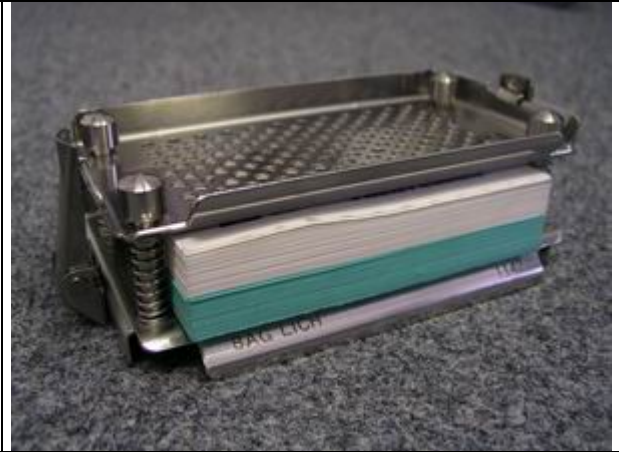
kovový stojánek pro AutoCheck Kit I a II