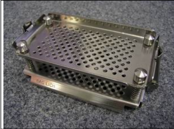
kovový stojánek pro AutoCheck Kit I a II