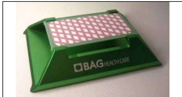
STOJÁNEK PRO BAG-GREENCARD

opakovat test, abychom se ujistili, že důvodem nebyla ojedinělá událost v průběhu jednoho cyklu, a že bylo provedeno řádné přehřátí sterilizátoru.